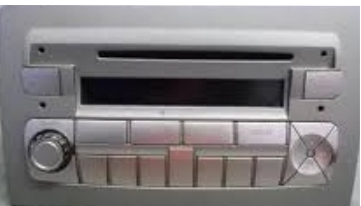
Fiat IDEA-Lancia MUSA