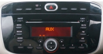
Punto EVO -->2012