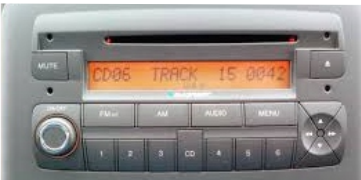
Croma dal 2005->